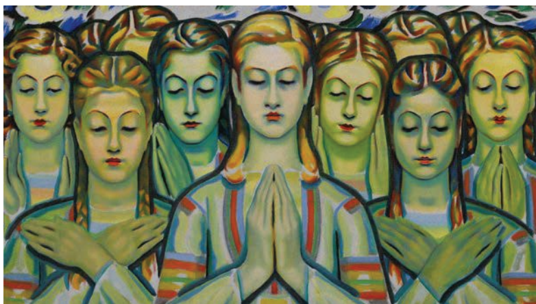
Владимир Димитров Майстора, Молитва

от духовната култура на съвременния човек са съвременните митове? Ако са несъществуващи – тогава как без изследване на митове и митологични системи могат да се обяснят войните в бивша Югославия или геноцида в Руанда през 90-те години на XX век? Може ли без изследване на съвременните митове да разберем съвременния човек? Очевидно трябва да се приеме, че митовете са конституентна част от духовния свят на съвременния човек и в частност българина. А без тях просто няма „човек“. Ето няколко малки примера за фундаментални съвременни митове: