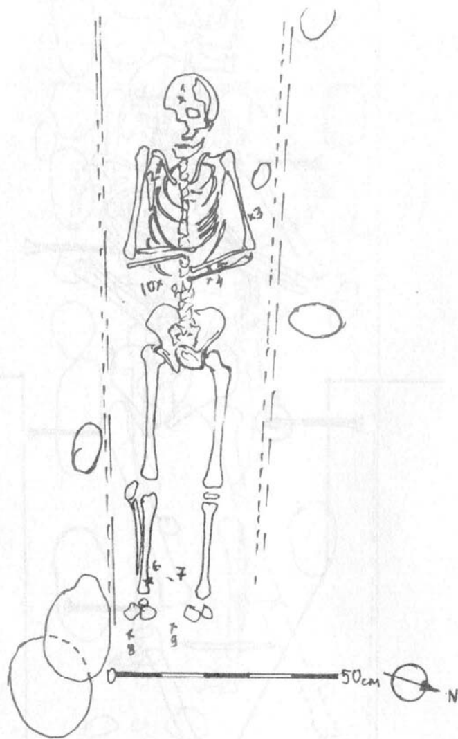
Фиг. 3 Бельова черква. Гроб No. 15. Дълбочина - 0,90 м. Находки: 1. Монета; 2. Метално кръстче; 3. Телено копче; 4-7. Телени копчета; 8-9. Железни подкови за ботуши; 10. Бронзов пръстен. ===== - следи от изтляло дърво